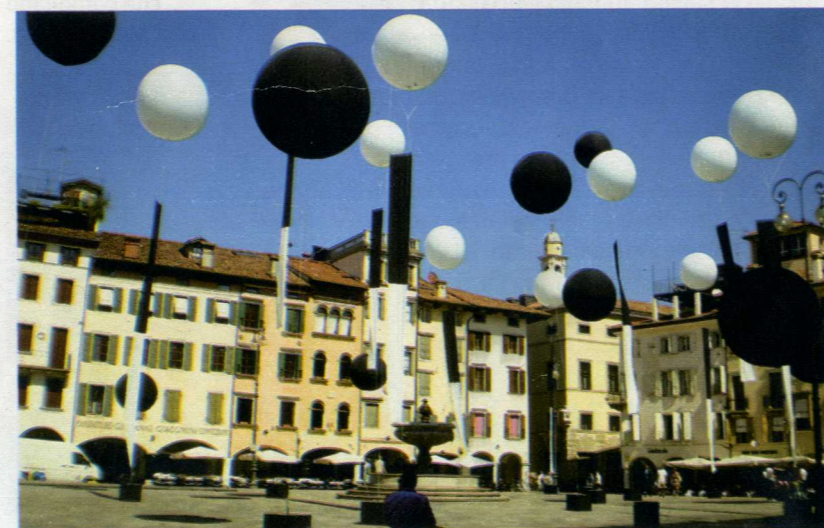
SOPRA: LA SPIAGGIA DI LIGNANO SABBIAORO. A SINISTRA: IL CENTRO DI UDINE IN BIANCO E NERO.

rismo Fvg l'offerta: Vacanze al mare per famiglie). Un bel modo per ritemparsi a contatto della natura è quello di andare a cavallo. Nella regione ci sono numerosi percorsi proposti dalle strutture specializzate nell'ospitalità dei cavalieri e dei loro accompagnatori. E chi ha poca esperienza trova il corso più adatto alle proprie esigenze.