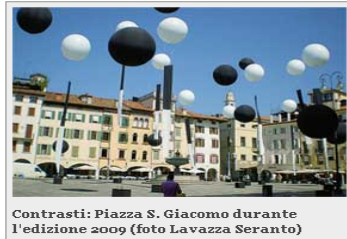
Contrasti: Piazza S. Giacomo durante l'edizione 2009

in diverse forme artistiche e culturali contestualizzate nei luoghi più suggestivi della città.