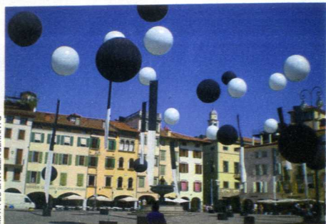
Bianchi e neri Scorcio di piazza San Giacomo a Udine. Sotto, uno scatto di Helmut Newton.