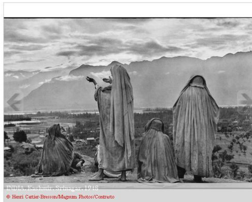
INDIA, Kashmir, Srinagar, 1948

Udine si animerà anche con incontri e dibattiti a tema, "Eventi di parola", durante i quali intervengono giornalisti, opinion leader, autori e scrittori. Per rimanere in tema, appunto il bianco e nero, il campione del mondo Boris Spasskij sarà il protagonista di un avvincente torneo di scacchi, e per confermare ancora una volta la bontà di questa regione, non mancherà la raffinata Serata enogastronomica di gaia (8 settembre).